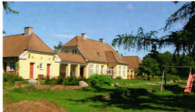
Christianshede Station smukt bevaret inklusive perroner med ny overflade; Græs.

Området Rankhøj og Sepstrup Sande kommer rigtig til sin ret her fra banedæmningen.