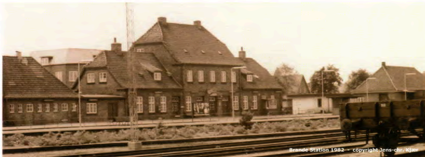
Brande Station 1982

Den skæve bane med Randers i den ene ende og Bramming / Esbjerg i den anden havde til formål at sikre eksporten af friske landbrugsvarer til det engelske marked. Desuden skulle de midtjyske skovbrug have